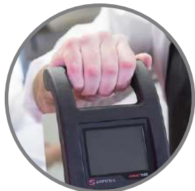
Asa en poliamida