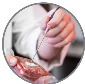
Sonda a corazón opcional