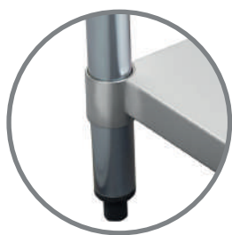
Perfil tubular redondo