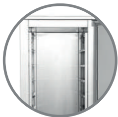
Niveles para GN 1/1