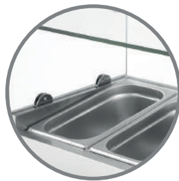
Área depósitos GN