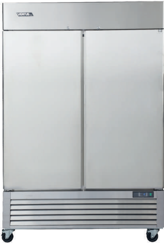
Controlador Digital Carel

Equipo ideal para comercio y cadenas Food Service