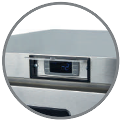
Controlador Digital Carel