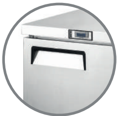
Puertas acero inox. con manilla empotrada