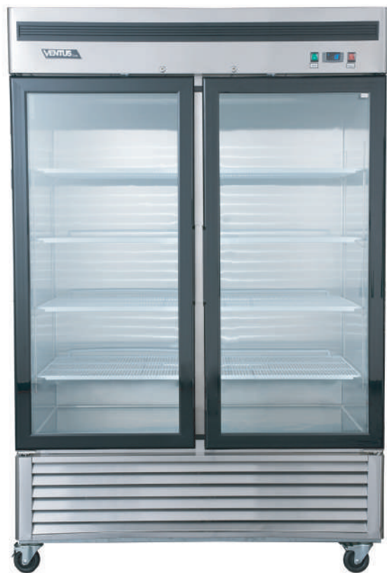
Controlador Digital Carel